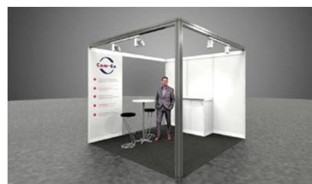
inkl. 2,5 Seiten geöffnet