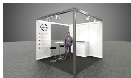
inkl. 2,5 Seiten geöffnet